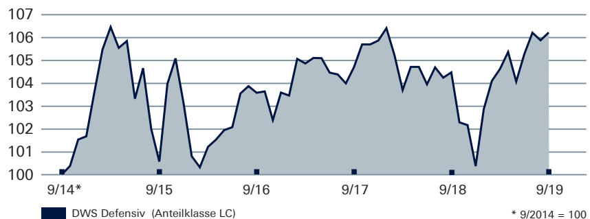
DWS DEFENSIV Wertentwicklung auf 5-Jahres-Sicht

Wertentwicklung nach BVI-Methode, d. h. ohne Berücksichtigung des Ausgabeaufschlages. Wertentwicklungen der Vergangenheit ermöglichen keine Prognose für die Zukunft. Stand: 30.9.2019