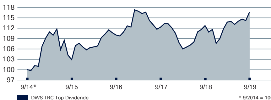
DWS TRC TOP DIVIDENDE Wertentwicklung auf 5-Jahres-Sicht

Wertentwicklung nach BVI-Methode, d. h. ohne Berücksichtigung des Ausgabeaufschlages. Wertentwicklungen der Vergangenheit ermöglichen keine Prognose für die Zukunft. Stand: 30.9.2019